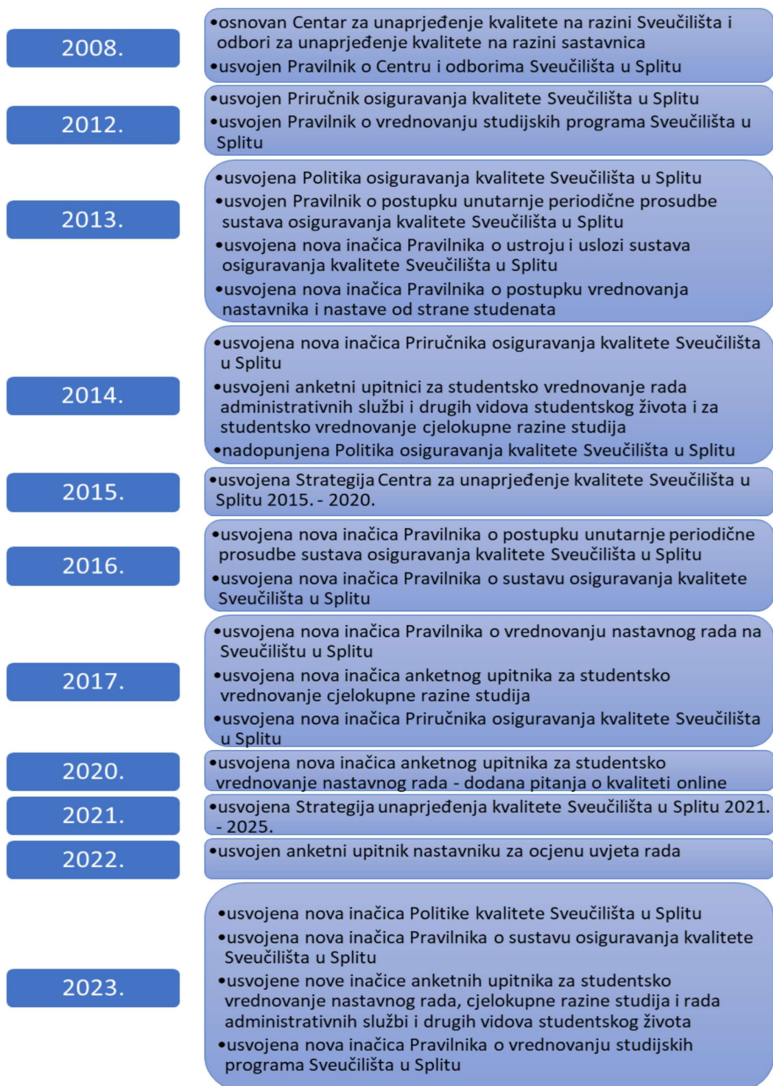
Slika 2: Prikaz razvoja sustava osiguravanja kvalitete Sveučilišta u Splitu kroz izmjene temeljnih dokumenata.